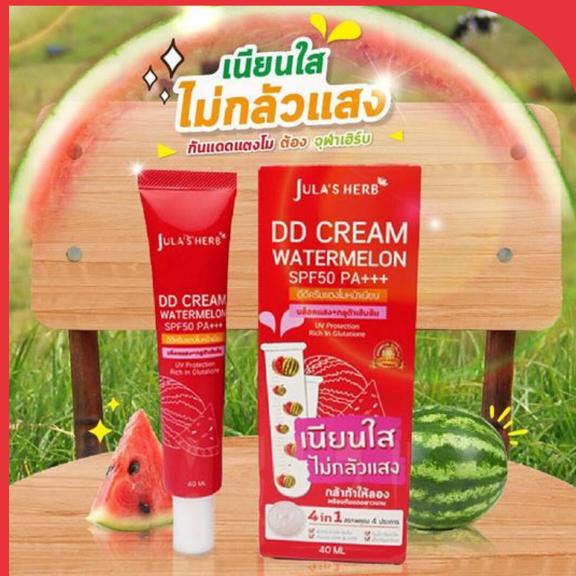
Goal # 1

Clarify the project's main overall objectives and goals.