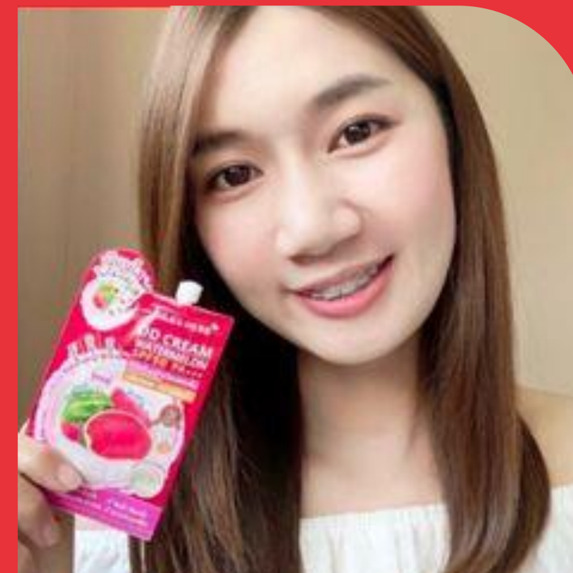
Goal # 3

สร้างไวรัลบนโลกออนไลน์ให้สินค้า เป็นที่จดจำ จนต้องไปซื้อมาใช้