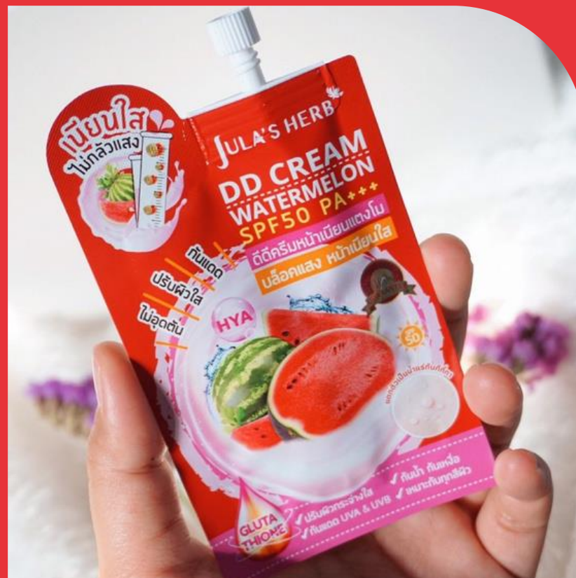
Goal # 2

ตอกย้ำความเป็นครีมแตงโมอันดับ 1 ในตลาด ครองใจคนไทยทุกรุ่น